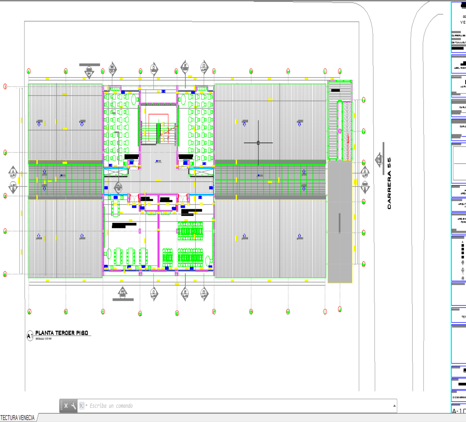
GRAFICO 3 PLANTA ORIGINAL DEL TERCER NIVEL BLOQUE 8 COLEGIO DISTRITAL VENECIA